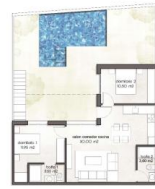
PB / GROUND FL.